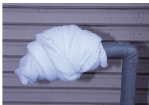
タオルなどを巻きつける