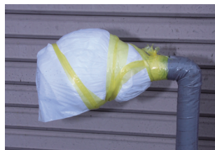
ビニール袋などで防水する