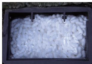
メーター上部も覆う