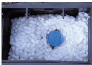
保温材を敷き詰める