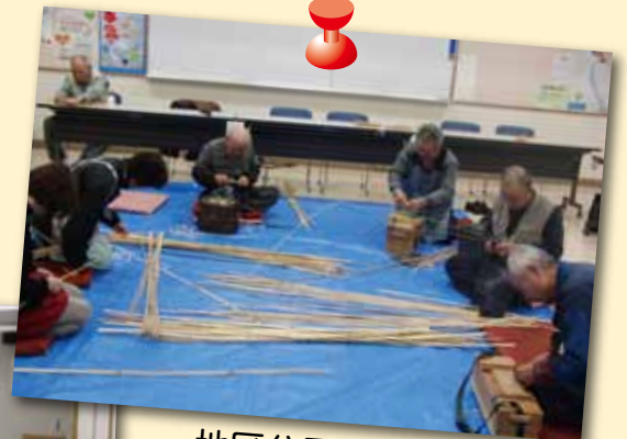
地区公民館での各種講座