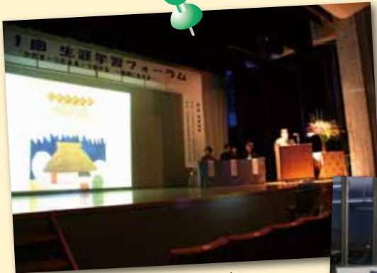
「生涯学習フォーラム」 の開催