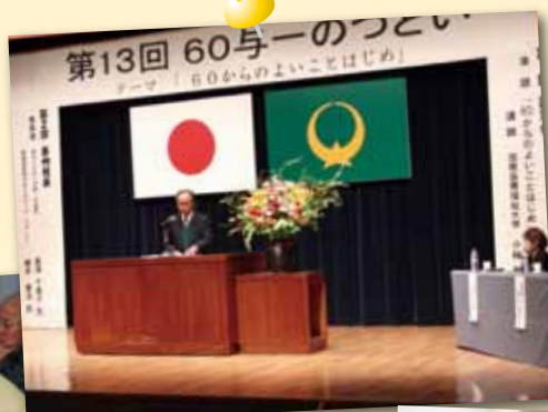
「60与一のつどい」 の開催