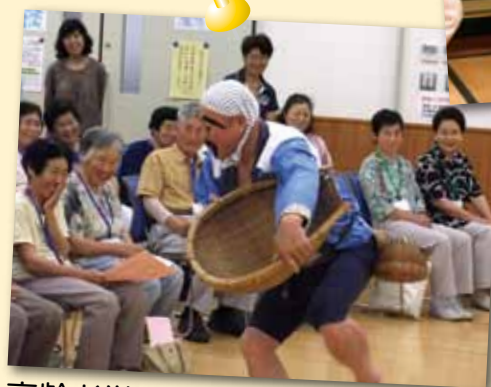
高齢者学級・講座等の実施