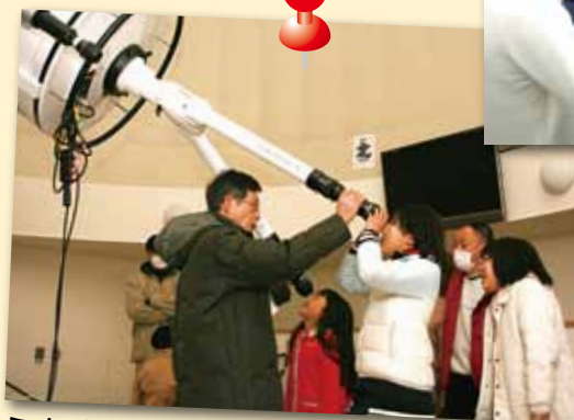
ふれあいの丘天文館 天体観測