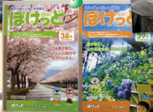
子ども情報誌 「ほけっと」の発行