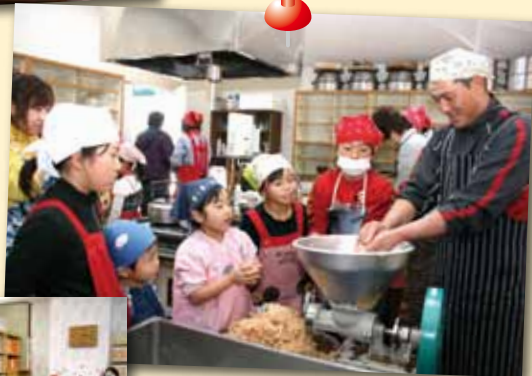
親子で味噌づくり 体験教室