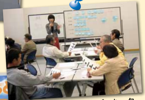
生涯学習コーディネーター の養成