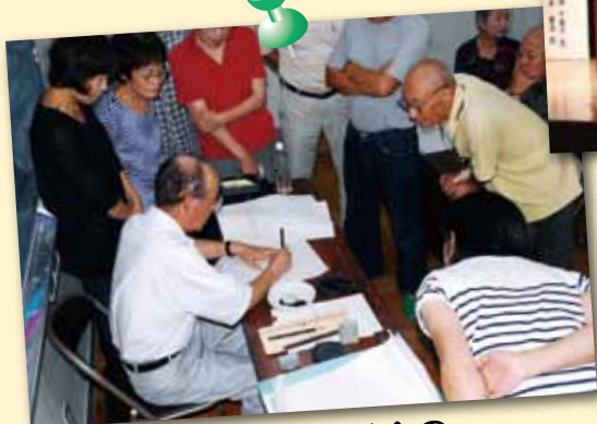
地区生涯学習推進協議会の 活動(写仏)