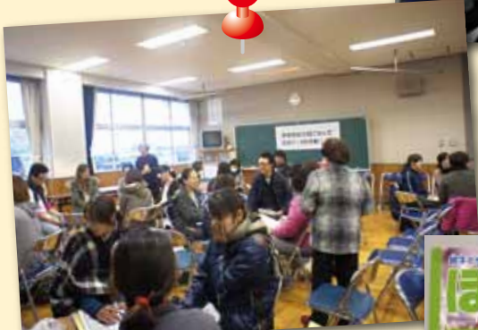
親学習プログラム