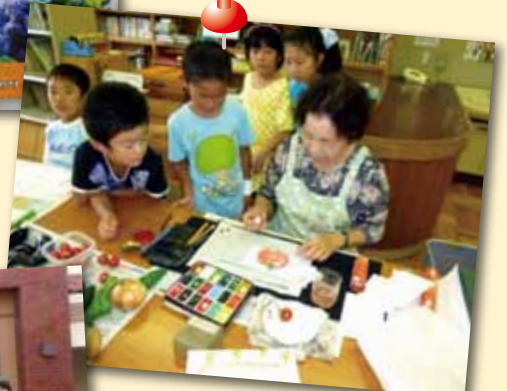
放課後子ども教室