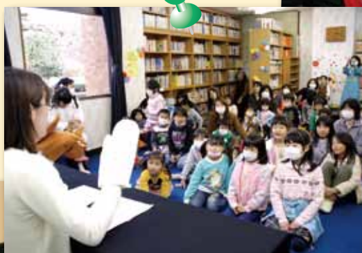
図書館でのお話会 の実施