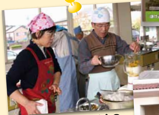
地区生涯学習推進協議会の 活動(男のクッキング)