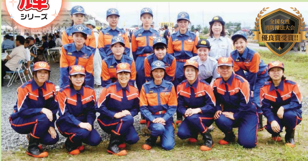
栃木県・大田原市総合防災訓練で「操法」を披露しました。(平成29年8月27日)