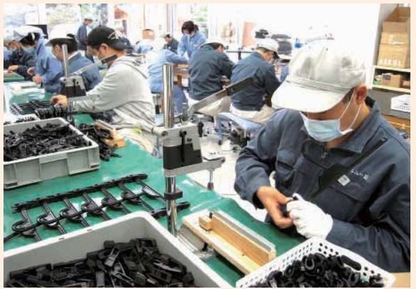
エルムの園 作業風景