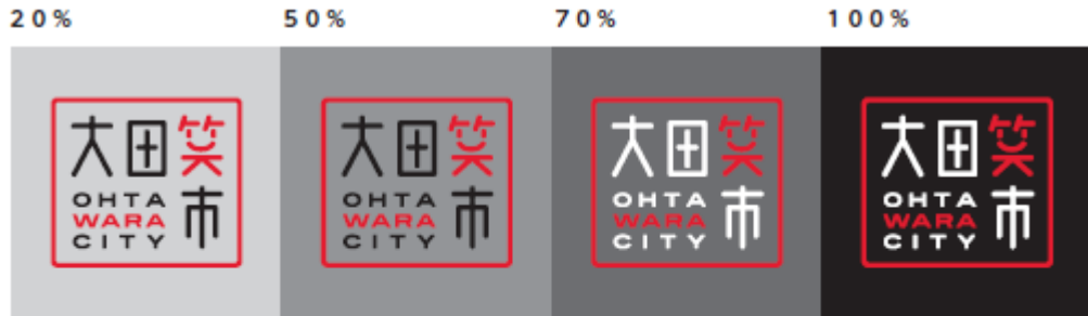
背景色が近似色の場合