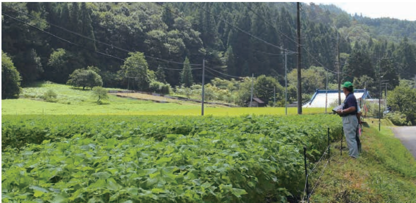
耕作放棄地だった土地が立派な《蕎麦畑》になっていました

「須賀川地区」の現状については、昨年の報告を聞いておりましたので、状況が良くなっていることを願っております。山間地域にあるそれぞれの集落では、ほとんどのみなさんが大切な農地をきちんと管理されていると思います。そこで目にした広大なそば畑。かなりの面積で荒れ果てていた農地が緑色のきれいな土地に変化しておりました。推進委員さんのお話により、と、耕作者が時間をかけて耕し、現在の規模まで増やしていかれたそうです。かなりの労力だったと推測されます。このような