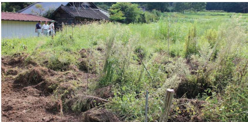
耕作放棄地で荒れている土地ですが、イノシシにとっては最適な餌場になっています

人口減少、高齢化、後継者不足などにより、廃農する農家が 증가しています。農地パトロールを実施しても、はたから見ると好立地条件に見える農地が、水利条件が悪かったり、悪土壌であったり、なるほどと言わざる負えないものが見えてきます。地域だけの取り組みでは荷が重すぎると思います。これは、