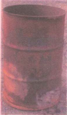
ドラム缶での焼却