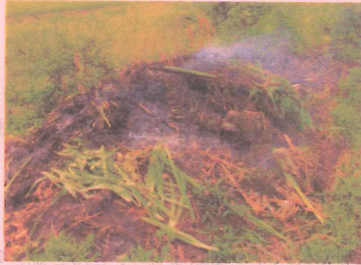
土場及び素掘り穴等での焼却