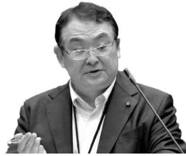
高瀬 重嗣 議員