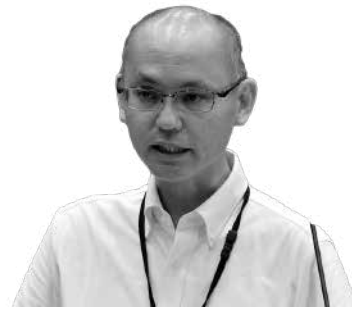
内藤 幹夫 議員