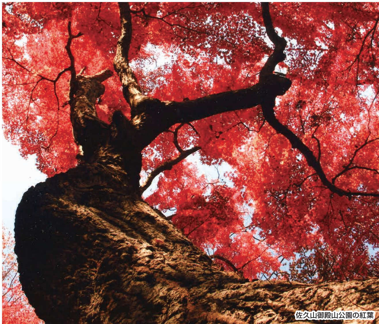
佐久山御殿山公園の紅葉