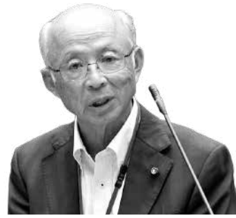
滝田 一郎 議員