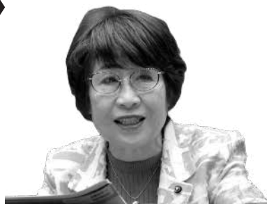
秋山 幸子 議員