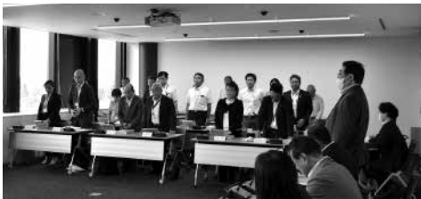
決算審査特別委員会の様子