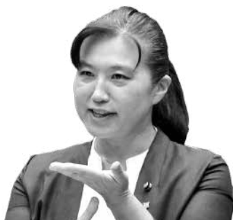
北原 裕子 議員