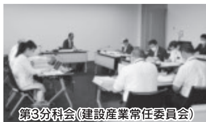
第3分科会(建設産業常任委員会)