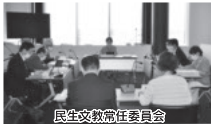
民生文教常任委員会