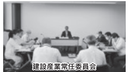
建設産業常任委員会