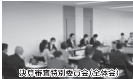
決算審査特別委員会(全体会)