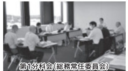
第1分科会(総務常任委員会)