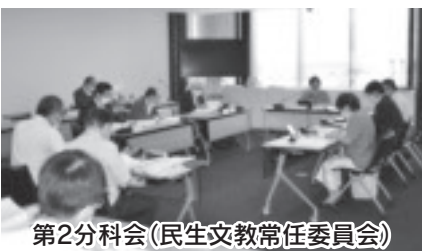
第2分科会(民生文教常任委員会)