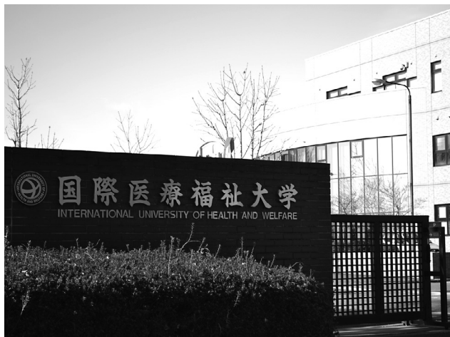
医学部新設が望まれる 国際医療福祉大学大田原キャンパス