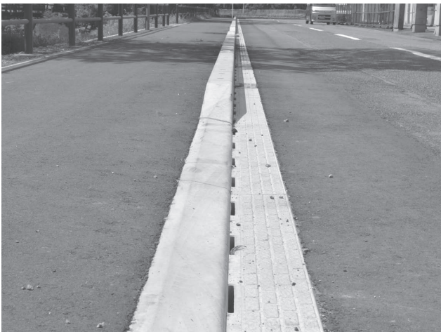
都市型側溝による施工箇所(鶯谷公園前)