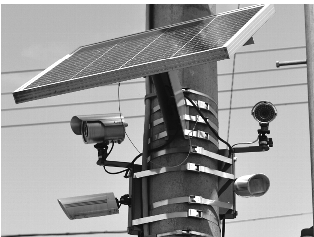
野崎駅自転車駐輪場設置の防犯カメラ

なお、導入に当たり、各学校でタブレットパソコンが効果的に活用できるよう学校の教職員等でプロジェクトチームを組織し、デモ教室や研修会を開催したり、モデル校を指定し、研究したいと考えています。