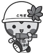
とちまるくん@栃木県