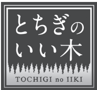
▲ 栃木県県産木材 ロゴマーク

問申 栃木県木材業協同組合連合会 〒321-2118 宇都宮市新里町丁277-1 TEL 028-652-3687 問 栃木県林業木材産業課 TEL 028-623-3277