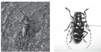
クビアカツヤカミキリ ツヤハダゴマダラカミキリ