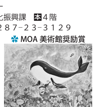
夢の海 ～花いっぱいの中～