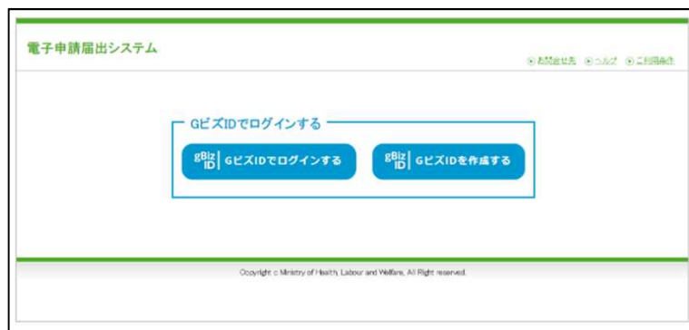
【本システムのログイン画面イメージ】

本システムでご利用できるGビズIDのアカウント種類は、「Gビズ IDプライム」と「Gビズ IDメンバー」のみになります。