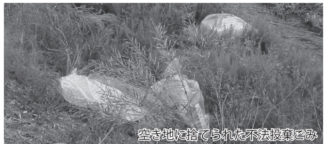
空き地に捨てられた不法投棄ごみ

板を設置し人が立ち入るのを防ぐ」、「定期的に草刈りを行う」など、適切な管理をお願いします。