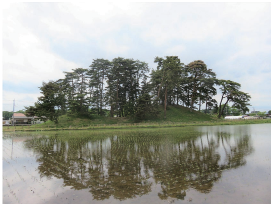
水田に映る下侍塚古墳

現在、なす風土記の丘湯津上資料館では、「侍塚古墳写真展」(12月2日(土)〜1月28日(日))の開催にあたり、上侍塚・下侍塚古墳の写真を募集しています。四季折々の侍塚古墳の姿や、昔の侍塚古墳周辺の姿など、奮ってご応募ください。