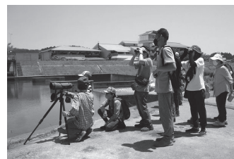
昨年度の探鳥会より