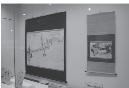
テーマ展会場の様子