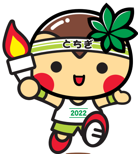
第77回 国民体育大会