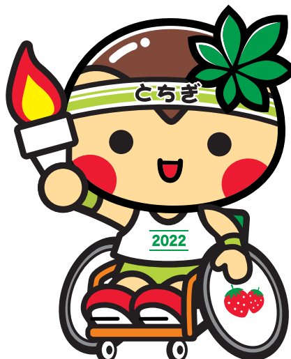
第22回 全国障害者スポーツ大会