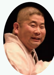
桃月庵 白酒 ◎橋蓮二