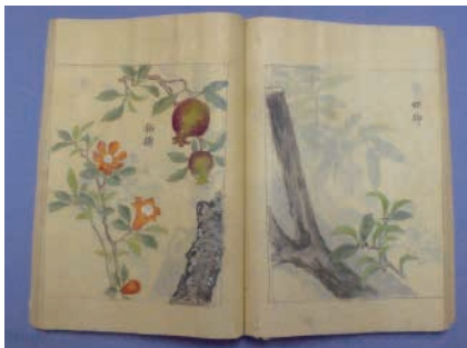
▲『止戈枢要』176巻本より『彩色類聚』下巻

本冊を含む『止戈枢要』中の28冊は、現在当館で開催中の企画展「文化人大名大関増業の編著書」において12月11日④まで展示中です。ぜひご覧ください。