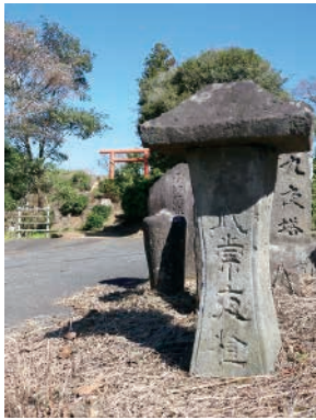
▲愛宕神社と練貫の道標

練貫の分岐点には、「左、原方那須湯道」「右、奥州海道」と刻まれた宝暦6年(1756)建立の道標(永代常夜燈)が今もあります。