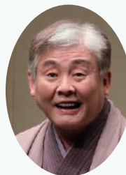
柳家 喬太郎 ◎横井洋司