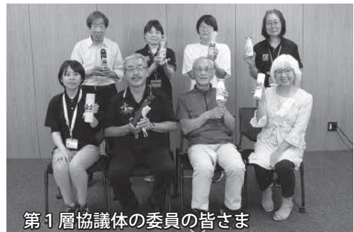
第1層協議体の委員の皆さま