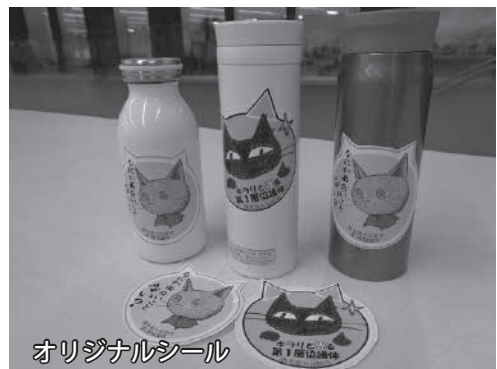
オリジナルシール