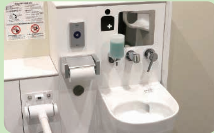
市役所本庁舎1階のオストメイト対応トイレ。入口にはマークを表示しています。