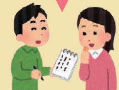
手話のかわりに筆談で