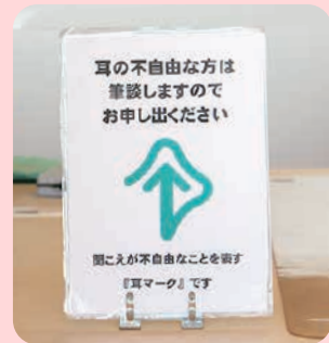
大田原市役所の窓口では、耳マークの表示板を設置しています。