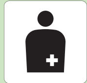
オストメイト用設備 オストメイトマーク

右のマークは、オストメイトであること、オストメイト対応のトイレがあることを示しています。