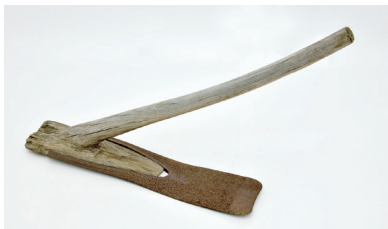
湯津上地区のクワ (歴史民俗資料館所蔵)

文政5年(1822)に刊行された『農具便利論』(江戸時代の農具図鑑・農業技術書)には、全国各地で使用されているクワについて、寸法や重量などとともに絵入りで説明されています。また、「鍬は国々にて三里を隔てずして違ふものなり」と記されています。当時からクワには地域差があり、それがクワの特徴であったことがうかがえます。