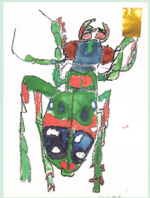
金丸こども園 いじまれんさん