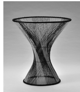
第24回全国竹芸展 最優秀賞『薄明』

令和2年11月に開催を予定していましたが、過去24回分の入賞作品などを集めた回顧展としてホームページ上で公開しています。素晴らしい竹工芸品の数々をパソコンやスマートフォンで、ぜひお楽しみください。