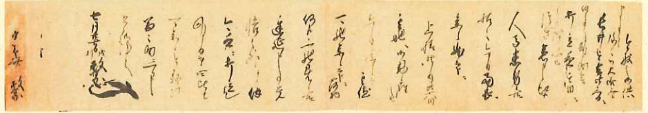
<伊達政宗書状 栃木県立博物館蔵>