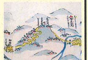
<道中案内(部分)福島県立博物館蔵>

☆新型コロナウイルス感染症の影響により、展示内容・日程が一部変更されました。(令和2年6月13日改訂) 今後もさらに変更される可能性がありますので、詳細は各館にお問い合わせください。