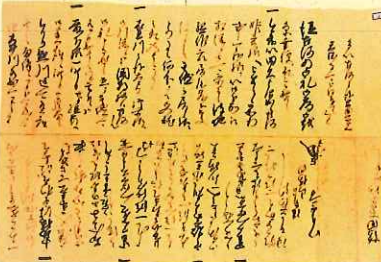
<喜連川文書 山中長俊書状 さくら市蔵(さくら市指定文化財)>