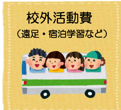
校外活動費 (遠足・宿泊学習など)