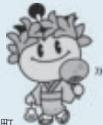
福島県棚倉町 シンボルキャラクター たなちゃん