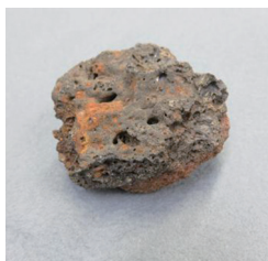
古代の炉壁(東裏Ⅱ遺跡) 【大田原市狭原】

那須地域では、県内でも最古段階である4世紀ごろには鍛冶の技術が伝わり、9世紀には集落の中で鍛冶や製錬の技術が定着したことがわかりました。7世紀から8世紀の製鉄遺跡は見つかっていませんが、近年実施した遺跡分布調査でも、新たに鉄づくりを行っていた痕跡が見つかっています。今後の調査によって、古代那須の製鉄のようすがさらに明らかになっていくことが期待できます。