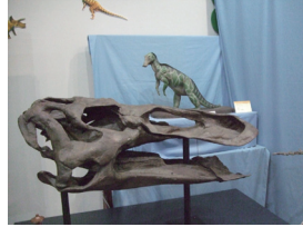
エドモントサウルス