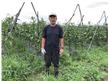
ナスの研修先にて

道程は平坦ではないと思いますが、皆さまの温かいご支援とご協力に感謝しながら、大田原市で夢を実現したいと日々奮闘中です。