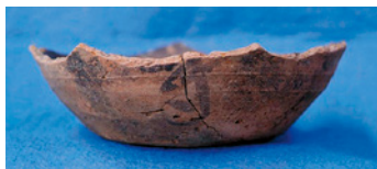
「寺」と書かれた土器(上)と灯明皿(下)