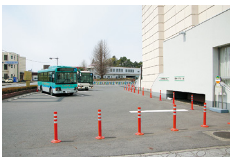
移設した「大田原市役所」バス停

新庁舎建設工事に向けた準備工事の開始に伴い、路線バス(市営バス・東野バス)の「大田原市役所」バス停を総合文化会館の前に移設しました。路線バスをご利用の際は、ご注意ください。