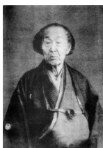
村上英俊肖像写真 (瀧田貞治『佛学始祖村上英俊』)