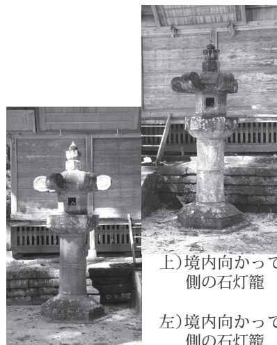
上)境内向かって右側の石灯籠

大宮温泉神社の石灯籠は、高増が金丸八幡宮に奉納してから27年後、高増の子の増栄が奉納したもので、江戸時代前期における藩主大関氏の信仰のあり方を物語る貴重な建造物です。