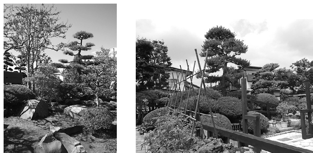
写真) 平成 26 年度受賞の庭