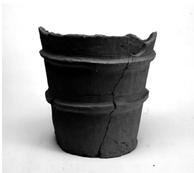
観音塚古墳の円筒埴輪

観音塚古墳から採集された円筒埴輪は、現在なす風土記の丘湯津上資料館で展示しています。観音塚古墳の所在を示した地図もご用意しております。この機会に、ぜひ足をお運びください。