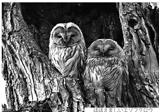
ほほえましいエゾフクロウ