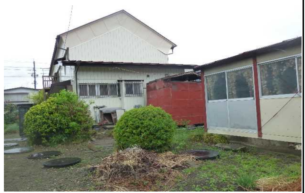
北側外観 ・ 倉庫