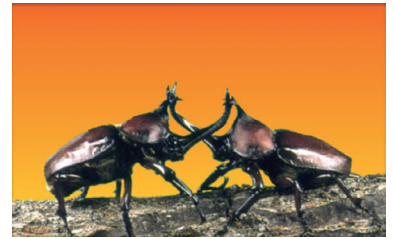
子どもと遊んだカブトムシ

カブトムシは、初夏の頃サナギになり、約3週間で羽化し、7~8月に成虫となり、9月には見られなくなります。一夏の短い期間ですが、カブトムシたちは産卵し、命のリレーをしているのです。(成虫の期間は約1~2ヶ月)