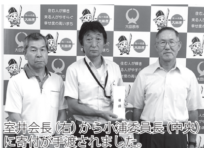
室井会長(右)から小浦委員長(中央)に寄付が手渡されました。

皆さまからお寄せいただいた寄付金は、大田原地区「佐久山納涼花火大会」、黒羽地区「くろばね夏まつり」、湯津上地区「天狗王国まつり」の各実行委員会に手渡されておりま