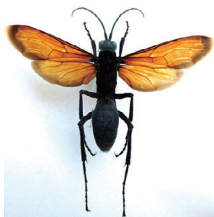
キョジンベッコウバチ

ベッコウバチはクモなどを狩りするカリバチ(狩蜂)で、触覚が長く、ハネがベッコウ色で、名前の由来になっています。日本にもオニグモやジョロウグモを捕らえるベッコウバチが生息します。