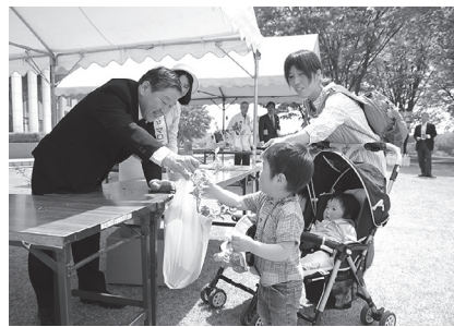
昨年の配布の様子

春の緑化運動のひとつとして、家庭の緑化を推進するために、苗木の配布をします。当日は「緑の募金」にご協力ください。