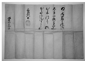
徳川家康朱印状 (福原家所蔵/当館寄託)