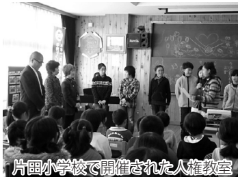
片岡小学校で開催された人権教室

12月4日からの人権週間の啓発活動の一環として、人権擁護委員が市内6カ所の小中学校を訪問し、人権教室を開きました。紙芝居や啓発ビデオなどを通して思いやりの大切さなどを伝え、児童・生徒たちは楽しみながら人権を身近なものとして学ぶことができました。