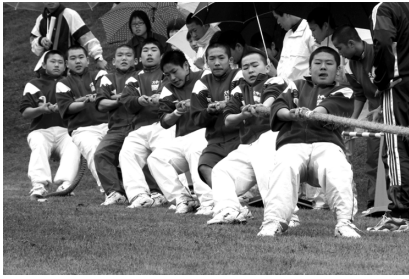
昨年中学生男子の部で優勝した大田原中学校柔道部