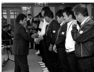
日本男子団体の表彰式の様子