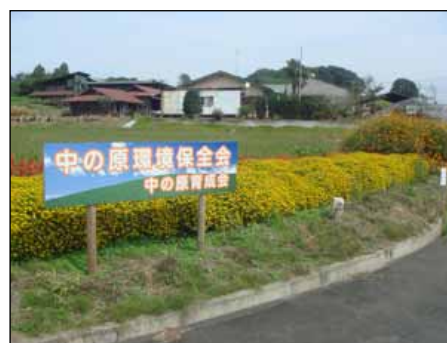
《市民が管理する沿道植栽》