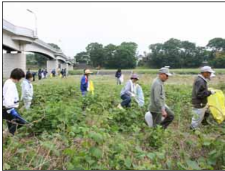
《企業が主催する清掃活動》