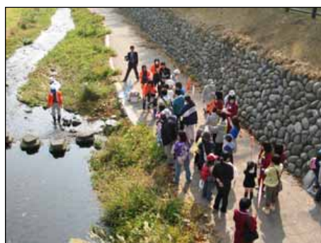
《多様なまちづくり活動》