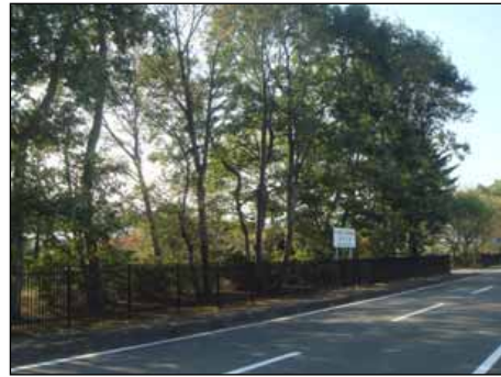
《周辺環境と調和した農工団地》