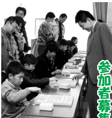
昨年の集いの様子

●日時 3月6日(土) 午前10時～午前11時40分 ●場所 ふれあいの丘シャトー・エスポワール