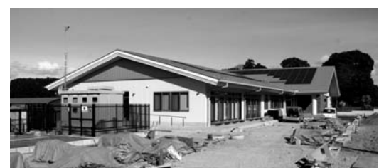
外構工事が進む「両郷地区コミュニティセンター」