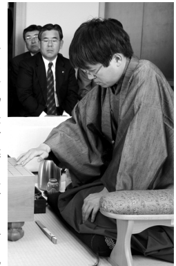
昨年本市で対局した羽生王将