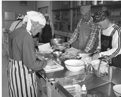
男のクッキング(大田原東地区)