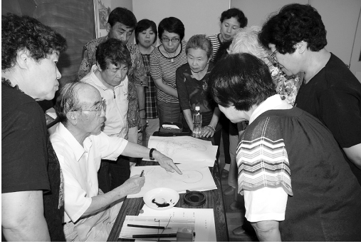
写仏講座(親園地区)

現在、市民主導の生涯学習推進協議会が、7つの各地区公民館エリアに設置されています。この生涯学習推進協議会は、「講座」「視察研修」「学校の教育活動支援」などの分野で、それぞれの地域の特色を生かし、市民主体で活動をしている組織です。