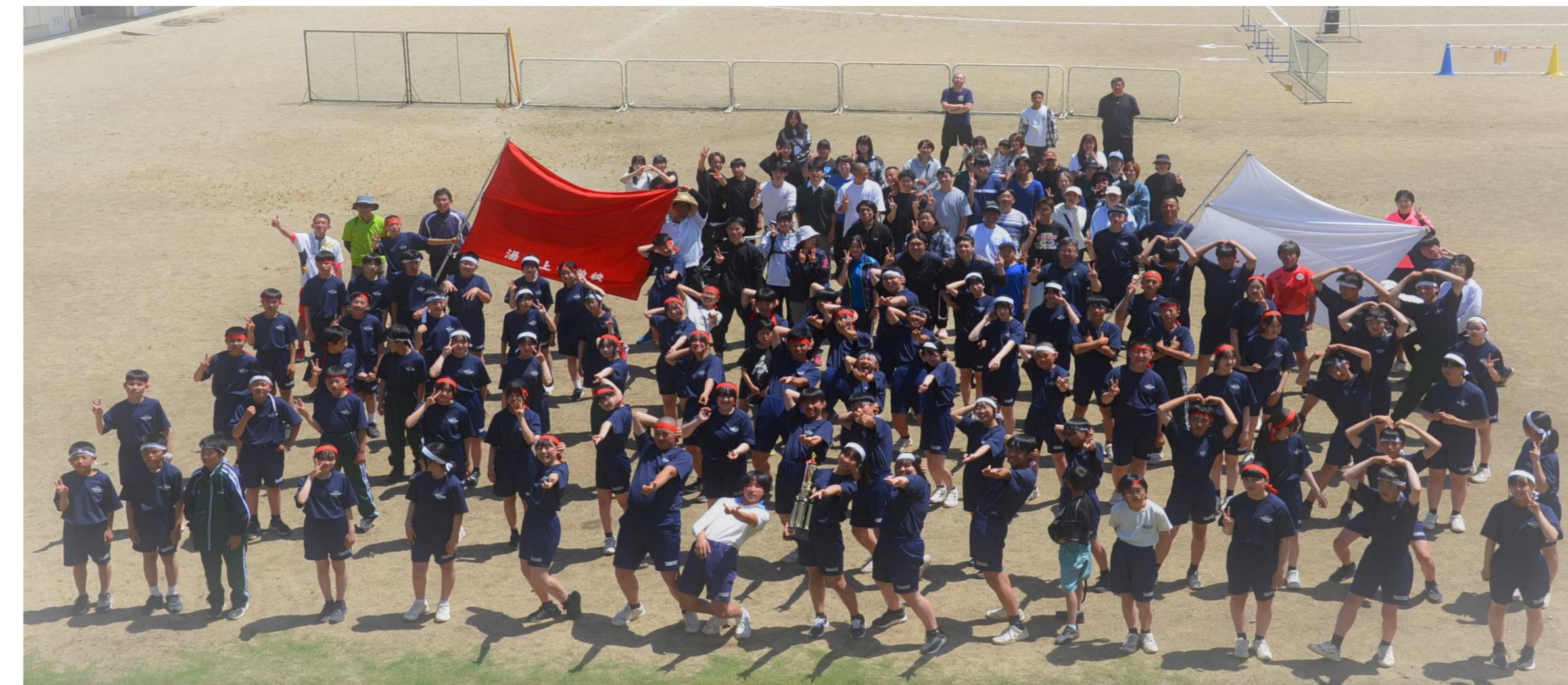
湯津上中学校体育祭 (R8.5.16)