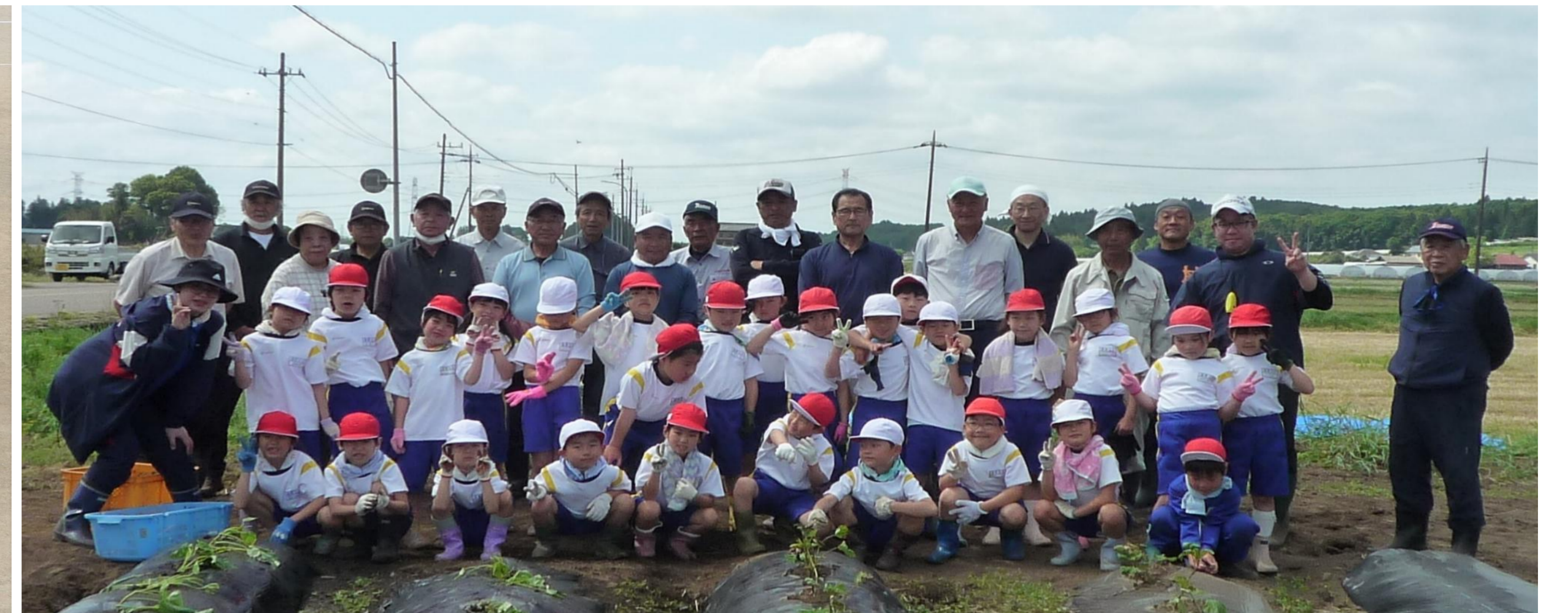
さつまいも苗植え体験 (1・2年) 湯小