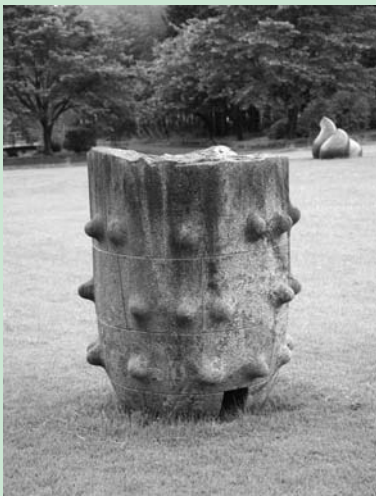
Eternal Cradle -再生- しばやま きょうこ 柴山 京子 1999年

ふれあいの丘芝生広場の北側にある大工房とシャトー・エスポワールをつなぐ上り坂の中腹あたりにこの彫刻は立っています。