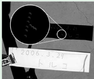
紙に小さな穴をあけて影を作ると光が太陽の形になる。